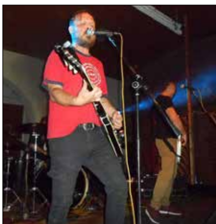
20. 8. 2021 - Rockový pátek Pow