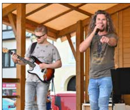
23. 6. 2021 - Polygon