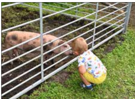
Chovatelský areál na Povalí