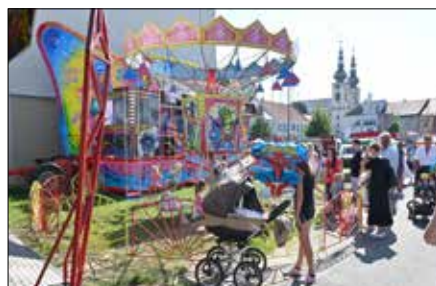
Atrakce pro děti