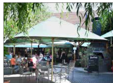
Živá hudba Na Hrázi