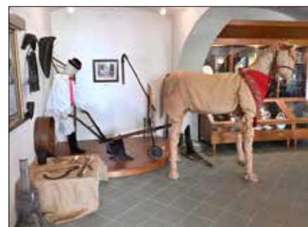
Ztracená tvář Hané