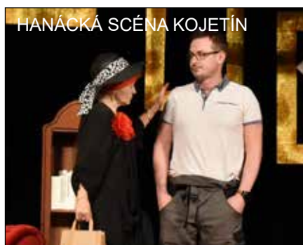
HANÁCKÁ SCÉNA KOJETÍN