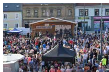
Návštěvníci na náměstí