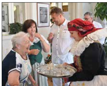
Zahájení hodů, komentovaná prohlídka výstavy Když Haná voní perníkem

Expozice Když Haná voní perníkem byla otevřena až do 17. září 2021.