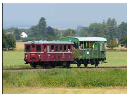
Historické vlaky - Kroměřížská dráha