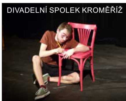
DIVADELNÍ SPOLEK KROMĚŘÍŽ