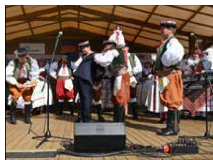
Předání hodového práva a vyplácení starosty ferolů