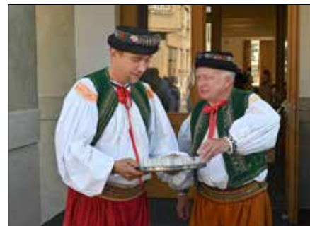
Přípravy krojovaného průvodu na Sokolovně Kojetín