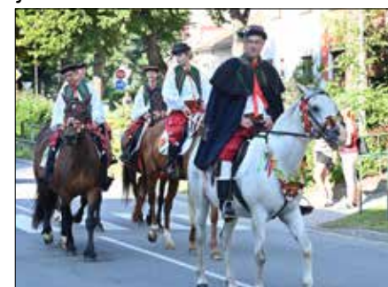
Krojovaný průvod a Ječmínková jízda králů