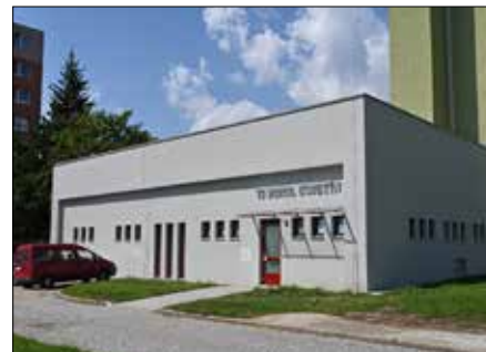
Nová herna stolního tenisu