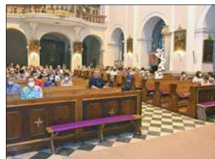
Benefiční varhanní koncert