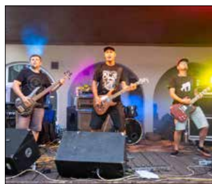
20. 8. 2021 - Rockový pátek IQ opice