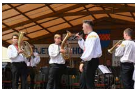
Dechová hudba Hanačka Břest