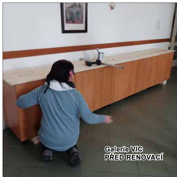
Galerie VIC PŘED RENOVACÍ