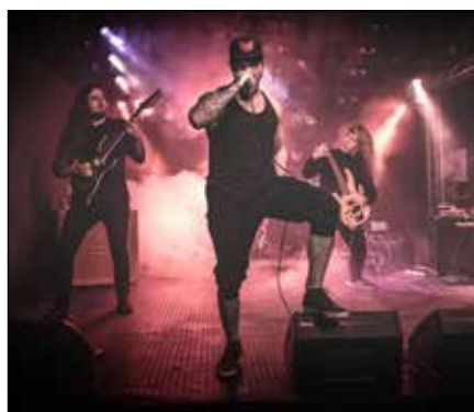
20. 8. 2021 - Rockový pátek Inception of Fall