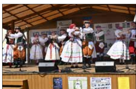
Hanácká beseda Kojetín