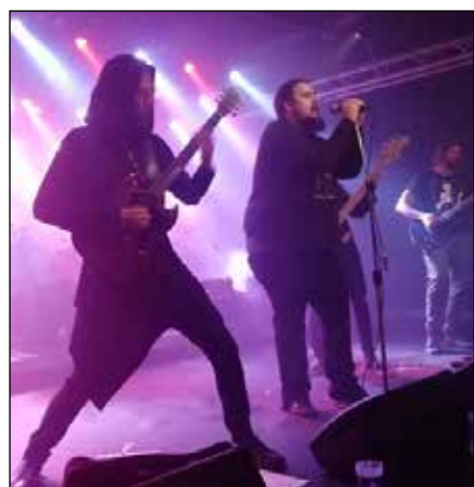
20. 8. 2021 - Rockový pátek Olovan