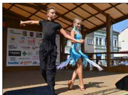
Taneční klub KST Swing Kojetín