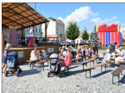
Odpoledne s Divadlem Koráb na náměstí