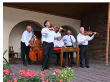
Cimbálová muzika Dubina