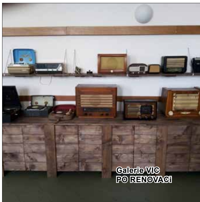
Galerie VIC PO RENOVACÍ