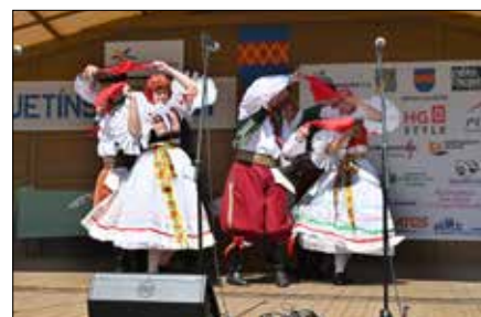
Hanácké sóbor Kroměříž