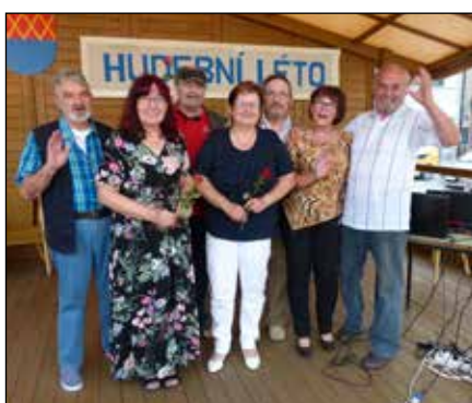
14. 7. 2021 - Hudba pro pamětníky