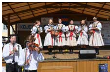
Chasa z Ořechova

návštěvníci mohli vidět aspoň malou ukázkou zahrádkářů v galerii VIC. Letošní hody se vyvedly na výbornou a díky patří všem, kteří se jakkoliv připojili k jejich zdárnému průběhu.