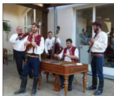
30. 7. 2021 - cimbálová muzika Bača