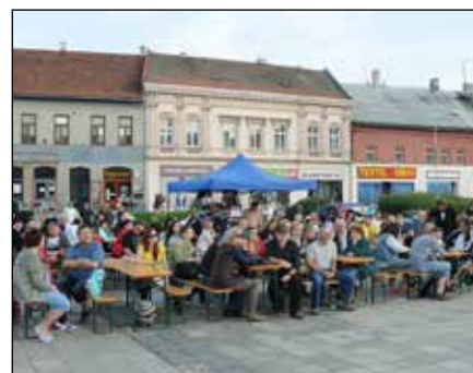
Návštěvníci Hudebního léta