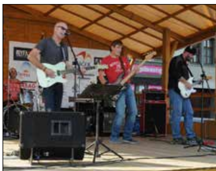
King Bee (Kojetín)