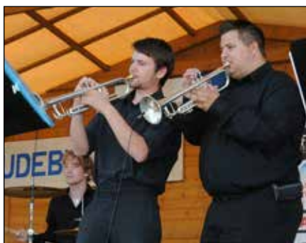
Vážaňanka (Vážany u Kroměříže)