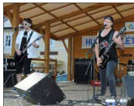
Breaking the Cycle (Přerov)