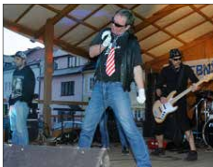
Černý Pencilin (Tovačov)