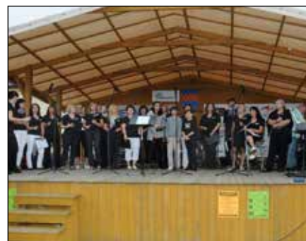
Pěvecký soubor Cantas Kojetín